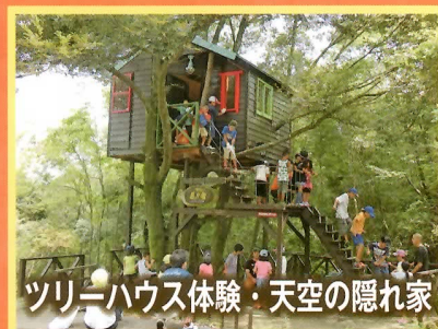
ツリーハウス体験・天空の隠れ家