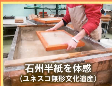
石州半紙を体感 (ユネスコ無形文化遺産)