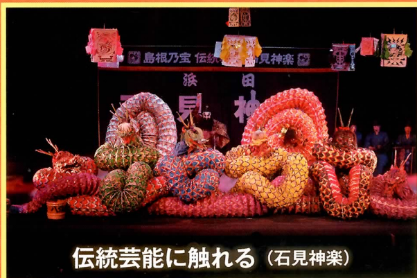
伝統芸能に触れる (石見神楽)